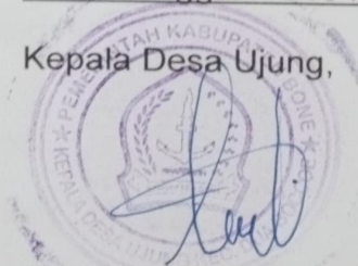
A.MUHAMMAD KHADAFI, SE